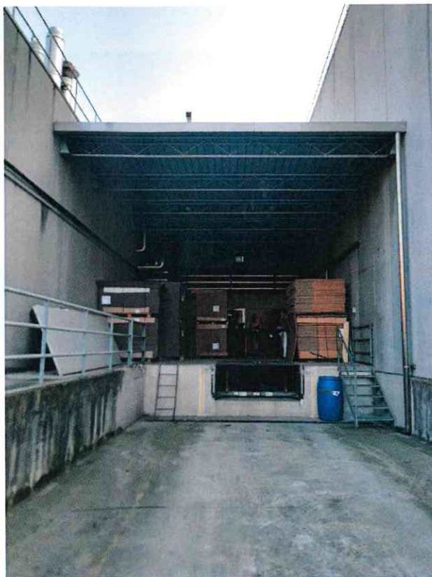
Vista della zona carico/scarico a servizio dello stabilimento SIFRA EST