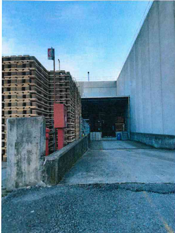
Percorso di accesso alla zona carico scarico a vista della copertura