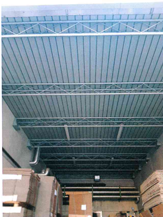
Dettaglio della struttura a sostegno della copertura